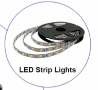
LED Strip Lights