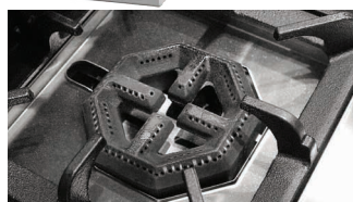
Quemadores de hierro fundido y de alta potencia